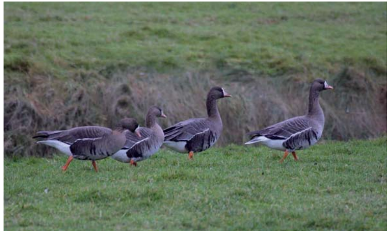
Blässgänse, Gaasterland bei Makkum - 30.12.2007.

Abtsweg, westl. Nagele (NL07-006): 1 Ind. unter Saatgänsen, 27.12.2007 – Normerven, Hippolytushoef (NL07-008): 12 Ind., 28.12.2007 – Deich bei Westerland, Quarantaineweg (NL07-009): ca. 30 Ind., beim nahen Amstelmeer, 28.12.2007 – Lauwersmeer, Vogelkijkhut "Jaap Deensgat" (NL07-016): 4 Ind., 29.12.2007 – Gaasterland südlich Makkum (NL07-018): >50 Ind., 30.12.2007