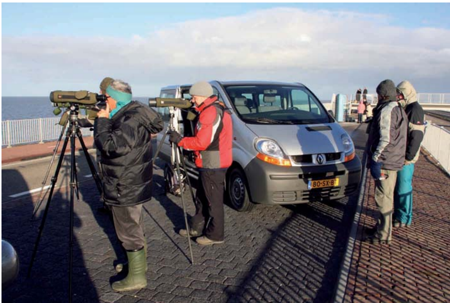
Auf dem Abschlussdeich, der das Ijsselmeer von der Nordsee trennt - 30.12.2007.

Der letzte Tag unserer kurzen Reise. Nach dem wir ausgecheckt und unser Gepäck im Bus verstaut haben, fahren wir kurz vor 9 Uhr los. Unser erstes Ziel ist das Gaasterland, wichtiger Überwinterungsplatz für Gänse am Nordostrand des Ijsselmeeres. Schon bevor wir das Gaasterland überhaupt erreichen, sehen wir entlang der Strasse und am Himmel grosse Gänsetrupps, meist sind es Weisswangengänse. In der Umgebung von Makkum sehen wir dann einige Tausend Weisswangengänse (wohl weit über 20000 Tiere!) sowie viele Blässgänse und Brachvögel. Nach diesem Spektakel fahren wir zum Abschlussdeich und halten an den gleichen Stellen wie zwei Tage zuvor, einfach in der umgekehrten Reihenfolge. Beim Deichrestaurant, welches sich von Nordosten her kommend auf etwa drei Vierteln der Deichlänge befindet, essen wir. Mittlerweile hat es nur noch sehr wenig Wind und das Wetter wird sogar angenehm mild. Am Nachmittag beobachten wir noch einmal beim Vogelbeobachtungspunkt Normerven in der Nähe von Hippolytushoef sowie am Deich beim Amstelmeer. Die letzte Station des Tages bildet dann