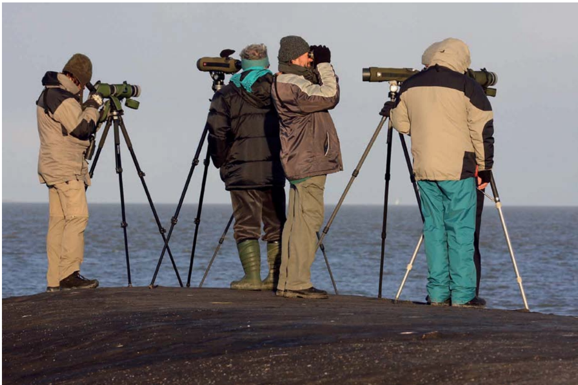
Im Hafen von Den Helder - 30.12.2007.

Aktuelle Infos zu den ornithologischen Geschehnissen in Holland findet man unter... www.dutchbirding.nl