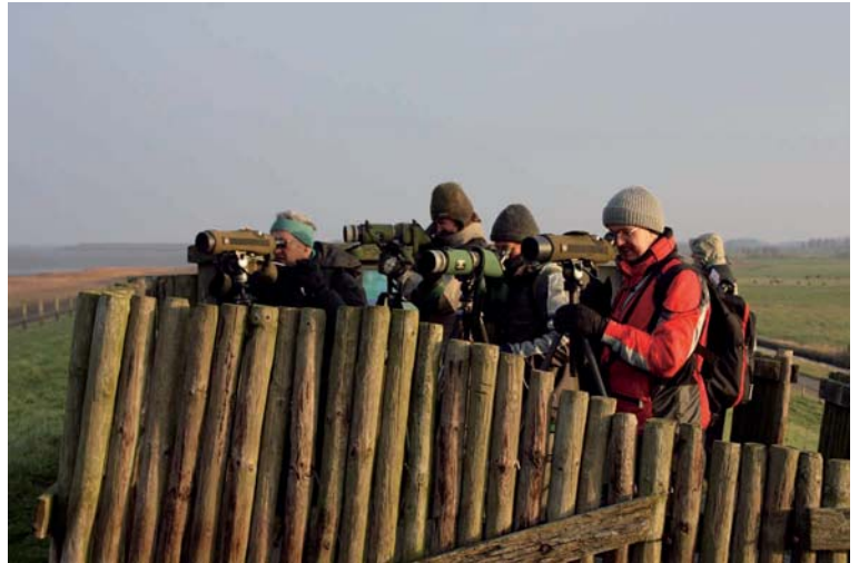
Beim Aussichtspunkt „Normerven“ nahe Hippolytushoef - 28.12.2007.

Nach dem Frühstück im Hotel brechen wir um 8.15 Uhr auf. Die Fahrt führt uns über den Abschlussdeich, welcher das Ijsselmeer von der Nordsee abgrenzt, in die Nähe von Hippolytushoef. Dort beobachten wir auf dem Deich vom Vogelbeobachtungspunkt „Normerven“ aus verschiedene Küsten- und Meeresvögel. Besonders eindrücklich sind die gut 2500 Austernfischer. Anschliessend kurze Fahrt ans Amstelmeer, wo wir zuerst am Deich die grossflächigen Schlickflächen und das Meer absuchen, später dann am Amstelmeer nach weiteren Wasservögeln Ausschau halten, wobei wir aber vor allem gegen den Wind kämpfen. Für das Mittagessen fahren wir auf den Abschlussdeich zurück, wo wir beim „Monument“ im Deichrestaurant einkehren. Vom Deich aus beobachten wir diverse Enten (u.a. über 700 Bergenten) und andere Wasservögel sowie als besonderen Leckerbissen einen Berghänfling, der aber abfliegt und nicht von allen gesehen wird. Die weitere Fahrt führt uns zurück Richtung Franeker. Unterwegs halten wir an zwei weiteren Stellen auf dem Abschlussdeich (bei Breezanddijk und am Ostende des Deichs bei Lorentzsluizen). Besonders herauszustreichen sind zwei Schneeammern, die wir bei Breezanddijk aus kurzer Distanz beobachten können.