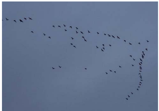
Weisswangengänse im Flug, Makkum - 30.12.2007.