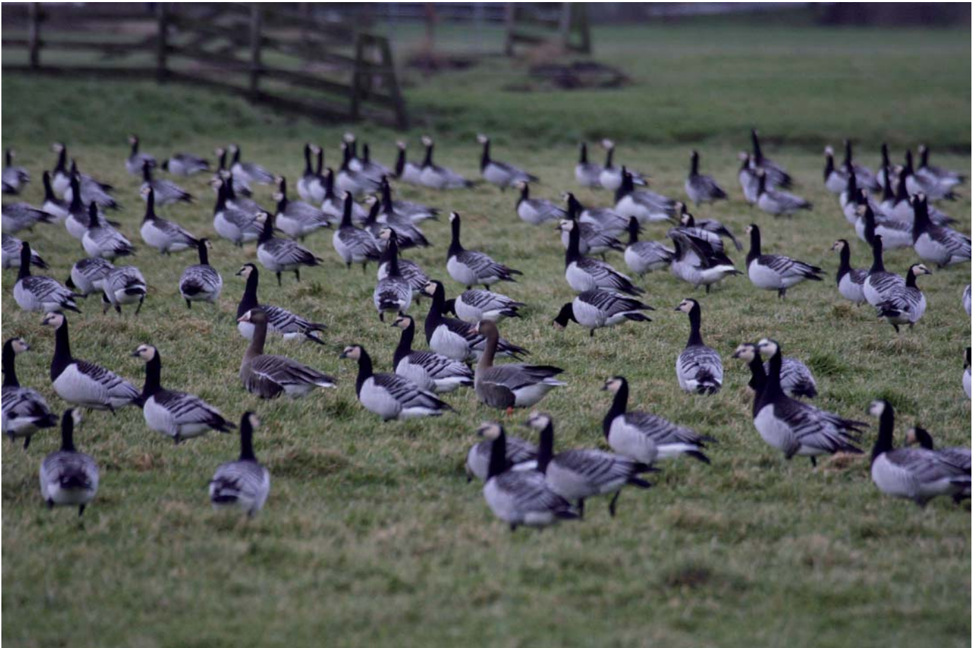
Weisswangen- und Blässgänse bei Makkum (Gaasterland) - 30.12.2007